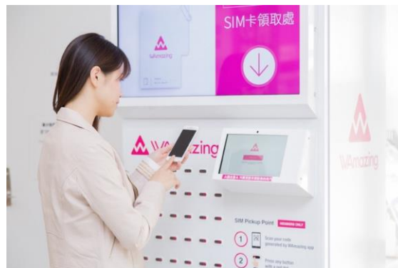
<SIM カード受け取りイメージ>

WAmazing の提供するサービスでは、アプリ内にて、日本国内の宿泊施設や観光アクティビティ、空港送迎などの検索・予約・購入などを中国語(簡体・繁体)で簡単に行うことができます。旅行者は、居住国で事前に本サービスの無料会員登録をすることで、日本滞在中の 15 日間、インターネット通信を 500MB まで使用できる SIM カードを、日本の主要空港にて無料で受け取り可能です。この度、2016 年 3 月に北海道新幹線(新青森～新函館北斗間)が開通し、北海道と本州を繋ぐ玄関口となった函館空港にて、SIM カード受け取り端末機の設置を開始し、より快適な訪日旅行のサポートを提供してまいります。